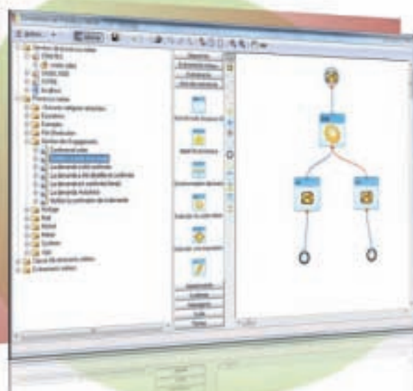
Le Workflow permet de structurer et de fluidifier les processus de gestion et les circuits de validation.