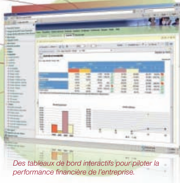
Des tableaux de bord interactifs pour piloter la performance financière de l'entreprise.