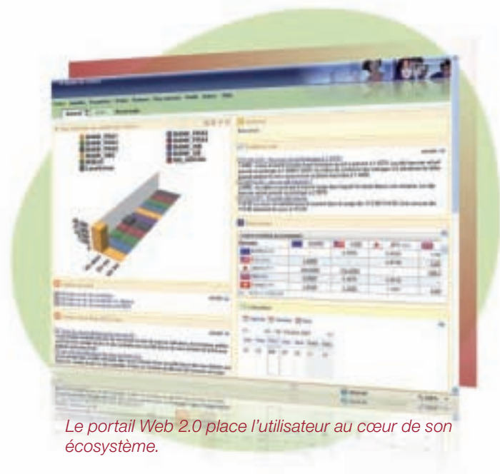
Le portail Web 2.0 place l'utilisateur au cœur de son écosystème.